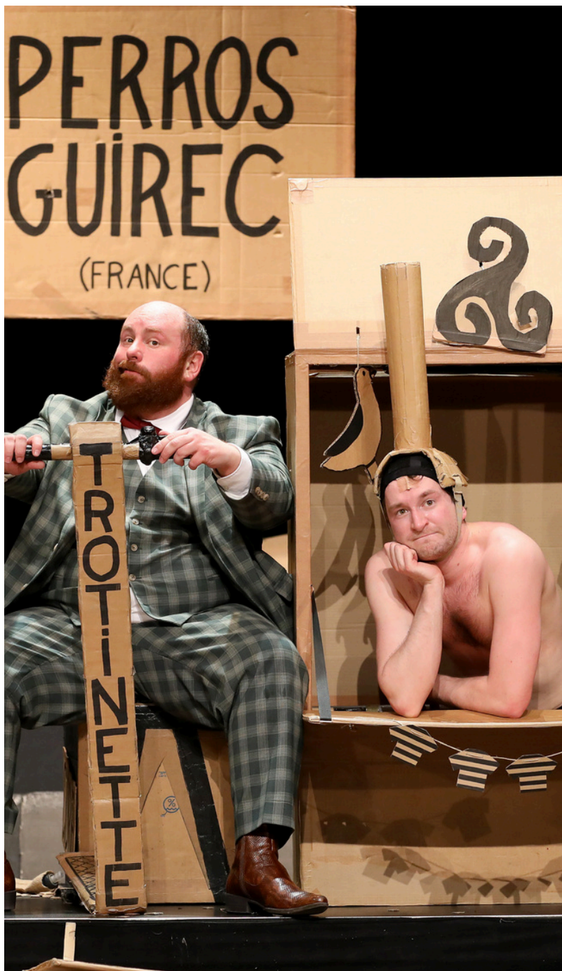
Les gros patiment bien