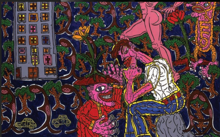
Robert COMBAS, Je pleure, je t'aime [détail] , 1987, huile sur toile, 190 x 245 cm © Robert Combas