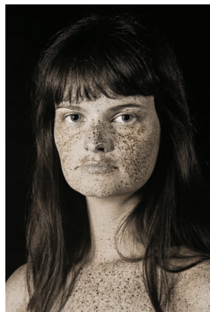
Loïc JUGUE , Portrait lent , 2018, extrait d'une installation vidéo de 20 portraits sur écran, 20'00" © Loïc Jugue | Olivier MASMONTEIL , Portrait de dos , 2014, huile et pastel sur bois, 148 x 114 cm © O. Masmonteil | Pierre-Louis FERRER , Brut #1 & #2, Clémence [détail], 2018, photographie en ultraviolet, diptyque, 60 x 90 cm © P.L. Ferrer

Sous la conduite de sa commissaire, Chantal Mennesson , et de sa nouvelle présidente, Sophie Deschamps-Causse , la Biennale d'Issy réunit une soixantaine d'artistes qui tous, reconnus ou moins connus du grand public, s'emparent d'un même thème pour investir les salles du Musée Français de la Carte à Jouer d'Issy-les-Moulineaux. Parmi ces 61 artistes, la moitié d'entre eux a été choisie dans le cadre d'un appel à candidatures lancé autour du thème Portraits contemporains : selfies de l'âme ? , l'autre étant des artistes directement invités à présenter une œuvre s'inscrivant dans la thématique ou faisant partie de collections privées.