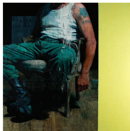
Jean FAUCHEUR , Autoportrait #1 , 1998, plâtre et tissu, 45 cm © Jean Faucheur | Christian LAPIE , Les parcelles lumineuses [détail], 2016, chêne traité à l'huile de lin sous vide, 600 x 250 x 200 cm © Christian Lapie | François BARD , Pour l'éternité , 2019, huile sur toile, 200 x 200 cm © François Bard